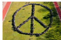
Schülervertretungen in Kooperation